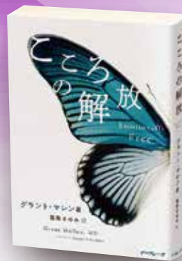
『こころの解放』 グラント・マレン著